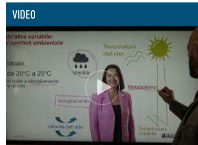
Sharp lancia lo schermo interattivo per videoconferenze smart