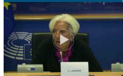
Lagarde: Gualtieri ministro bene per l'Italia e per l'Ue