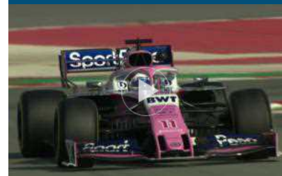
SportPesa: bene sponsorship Racing Point F1, puntiamo a crescere