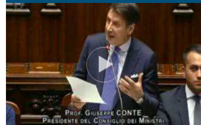
Conte alla Camera punta su manovra, dl sicurezza e patto Ue