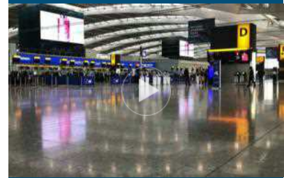
Londra, aeroporto di Heathrow deserto per sciopero British Airways